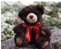
© AIDS-Hilfe Duisburg / Kreis Wesel e.V.

Alle Jahre wieder steht am 01.12. der Welt-AIDS-Tag vor der Tür. Seit 1988 erinnert man rund um den Globus an diesem Datum an die Themen HIV und AIDS. Verschiedene Organisationen rufen dazu auf, aktiv zu werden und Solidarität mit HIV-Infizierten, AIDS-Kranken und den ihnen nahestehenden Menschen zu zeigen. Der Gedenktag dient auch dazu, Verantwortliche in Politik, Massenmedien, Wirtschaft und Gesellschaft daran zu erinnern, dass die HIV-/AIDS-Pandemie weiter besteht.