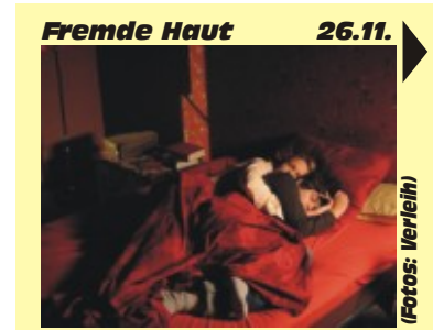
Fremde Haut 26.11.